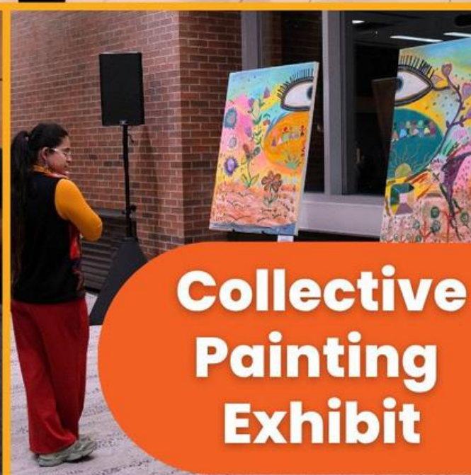
Collective Painting Exhibit