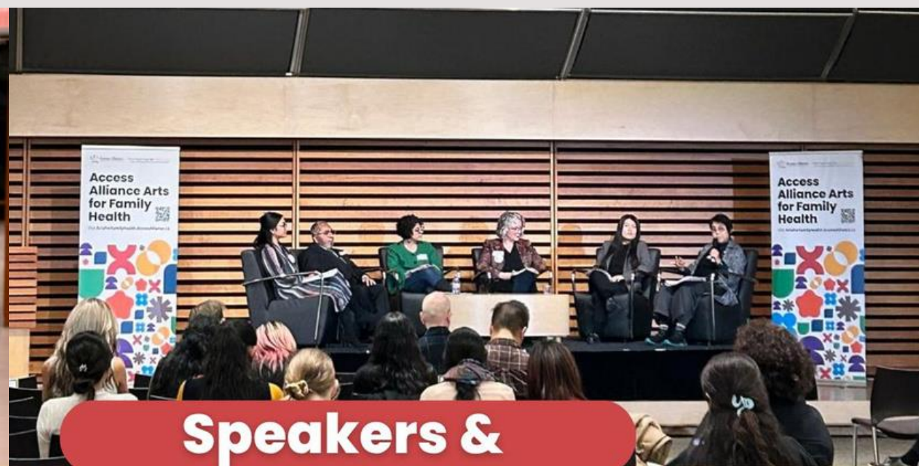
Speakers & Panel Discussion